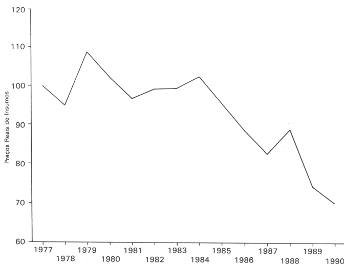
Gráfico 1: Evolução do Índice de Preços Reais de Insumos Agrícolas no Brasil, 1977/90 (1977 = 100)

De outro lado, a Tabela 2 mostra a evolução, durante 1977/1990, dos índices de preços reais dos principais insumos, agora incluindo máquinas agrícolas. Para fertilizantes e defensivos, a redução de preços reais foi bastante pronunciada. Apenas o grupo “máquinas agrícolas” é que teve aumento de preços reais a partir de 1988. Para combustíveis, a redução ocorreu a partir de 1984. O caso das máquinas agrícolas teve a influência predominante da maior tributação, via ICMS.